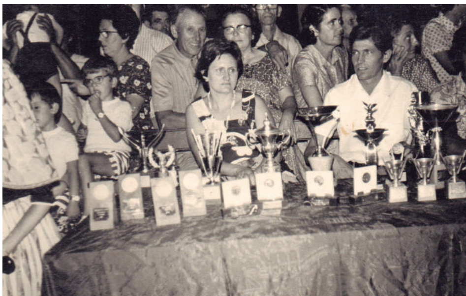
Trofeus preparats pel seu lliurament el darrer vespre de festes (principis dels anys 70 del passat segle).

a las nueve, Tercia y Misa mayor con panegírico del Santo. Por la tarde, a las cuatro, Vísperas y procesión. A las cinco, carreras de cintas para todos los corredores locales y exlocales que deseen tomar parte pudiendo pedirlo hasta media hora antes del comenzamiento de las mismas. Estarán bordadas por distinguidas señoritas de dicha localidad. A las seis, llegada de la Banda de música de Campos del Puerto que dará su aviso de entrada en dicha población con varios pasacalles por diferentes calles del pueblo. A las ocho de la noche (y como fin de fiesta), un grandioso baile amenizado por la antedicha banda en la Plaza Nueva.