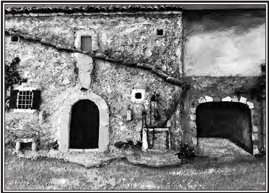
Cases de Son Durí

En definitiva, es tractava d'autèntiques explotacions agràries autosuficients que, a més de vendre els productes a l'engròs al intermediaris, també venien a la menuda a fi d'abastir de queviures la població local.