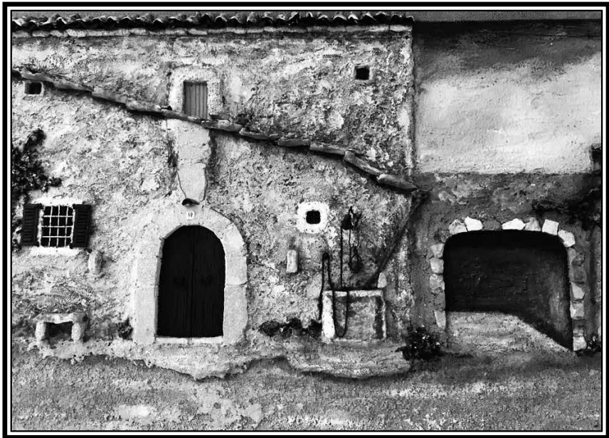
Cases de Son Durí

En definitiva, es tractava d'autèntiques explotacions agràries autosuficients que, a més de vendre els productes a l'engròs al intermediaris, també venien a la menuda a fi d'abastir de queviures la població local.