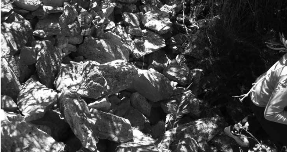
La Cova de sa Madona, tal com es trobava el mes de maig de 2014

objectes artístics i religiosos retirats del culte, per tal d'evitar la seva destrucció.